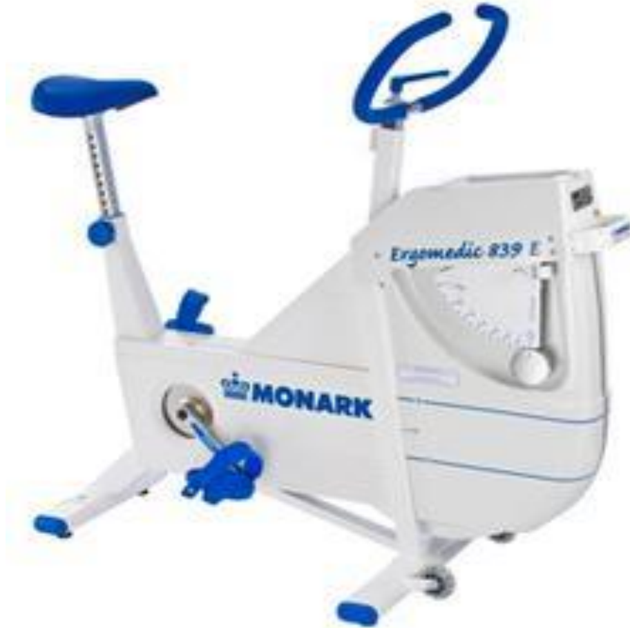
Şekil 2.1: Bisiklet Ergometresi

Bu protokolde Bisiklet ergometresi koşu bandı ile karşılaştırıldığında görece daha ucuz, az yer tutması ve ECG ve kan basıncı izleme olanağı vermesi yönleri ile sıklıkla kullanılmaktadır.