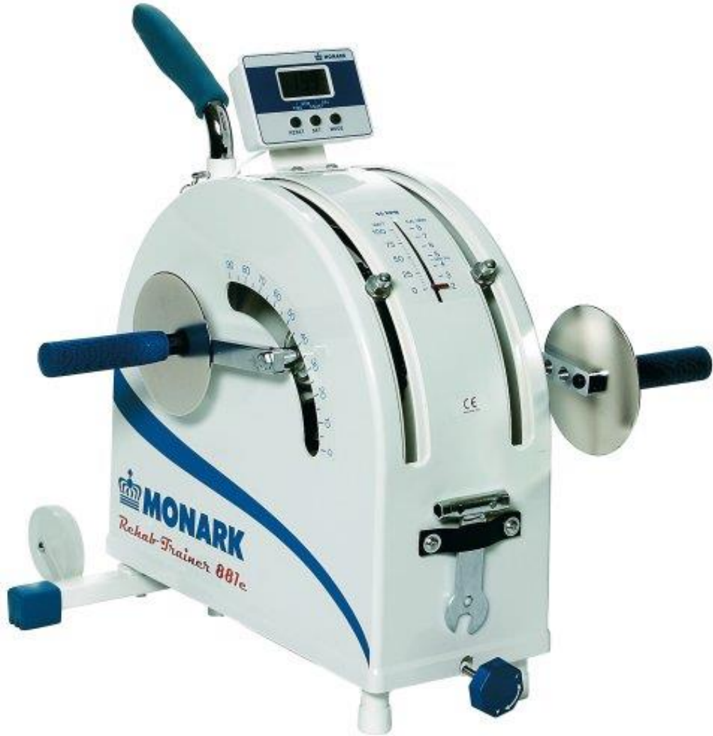
Şekil 2.2: Kol Ergometresi

Bisiklet ergometre testinin bacaklarını kullanamayan veya özellikle kollarını kullanmak isteyen katılımcılar için hazırlanmıştır. Bisiklet ergometresine göre VO 2 max %20-30 daha düşüktür. Kalp atım sayısı 10-15 vuruş daha düşüktür (Özer, 2016).