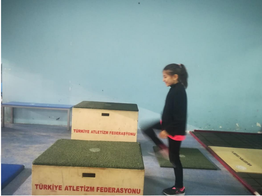
Şekil 2.3: Quens Basamak Testi