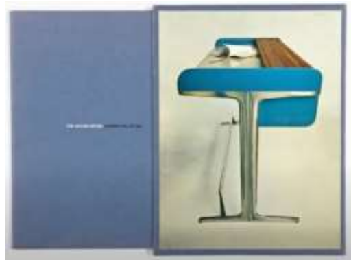
Şekil 2.6: Aksiyon Ofis