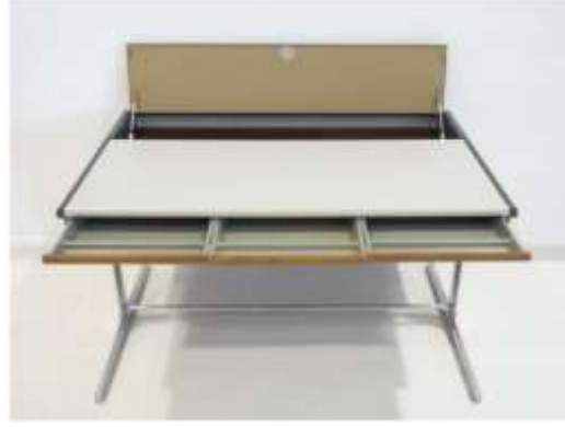
Şekil 2.7: Aksiyon Ofis Bölmeleri