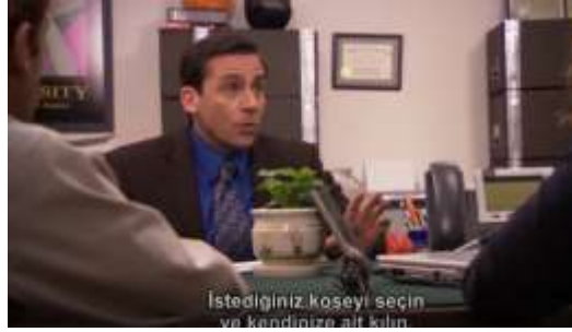
Şekil 2.5: The Office Ekran Görüntüsü [00:10:45] (1995)

çalışanların ofis mekânında kendilerine ait olduğunu hissettikleri özel bir alan seçip orayı sahiplenmelerini desteklemektedir.