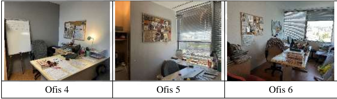
Şekil 4.2: Orta Derecede Kendileme Davranışı Sergilenen Akademik Ofisler

Ofis 6'daki katılımcının çalışma çevresinde masa üzeri organizatör ve kalemlikler, fotoğraf çerçeveleri, notlar ve hatıralar için bir pano, dekoratif objeler, bireysel aydınlatma elemanı, bilgisayar için yükseltici ve şahsi teknolojik ekipman (tablet) görülmektedir. Katılımcı ofisinde orta derecede kendileme gerçekleştirmiştir.