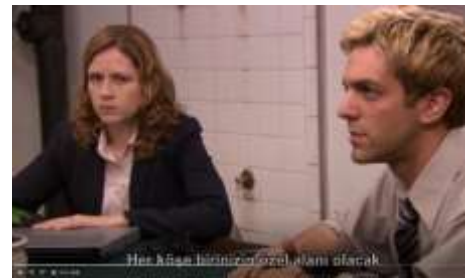
Şekil 2.4: The Office Ekran Görüntüsü [00:10:36 – 00:10:41] (1995)