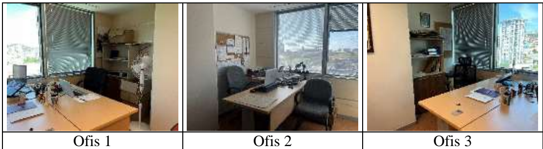
Şekil 4.1: Düşük Derecede Kendileme Davranışı Sergilenen Akademik Ofisler

Ofis 3'deki çalışma çevresinin sahibi olan katılımcı, masa üzerinde dekoratif objeler kullanmış, notları için bir pano, bilgisayar için yükseltici ve isimlik kullanmıştır.