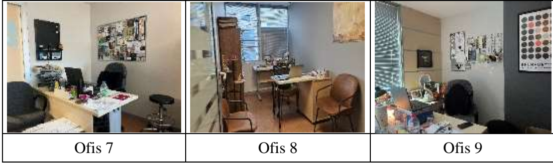
Şekil 4.3: Yüksek Derecede Kendileme Davranışı Sergilenen Akademik Ofisler

dekoratif öğeler, masa aydınlatması, ambiyans aydınlatması, kalemlikler, isimlik, fotoğraflar ve dekoratif tablo bulunmaktadır.