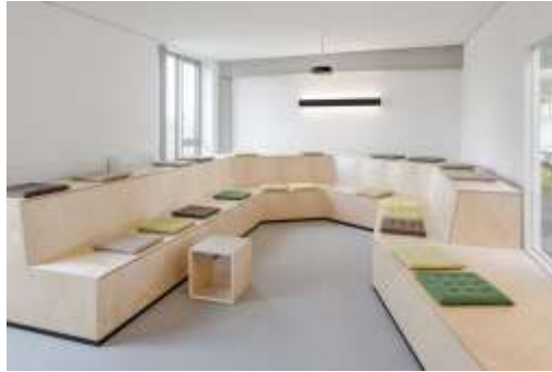
Şekil 2.3: Sosyopetal (Yakınlaştırıcı) Kurgulanmış Bir Toplantı Alanı Mindmatters Hamburg Ofisi

Buna göre sosyofugal mekânda insanların ayrıştırılması söz konusudur ve sosyal etkileşim kesilir. Sosyopetal mekânda ise farklı yönlerin birleşimiyle insanlar bir araya getirilerek etkileşim canlı tutulur (Buldaç, 2021). Sosyopetal mekânlara örnek olarak parklar, kafeler verilebilirken, sosyofugal mekânlara örnek olarak sınıf sıraları, kütüphane bölmeleri verilebilir. Çoğu mekân bu prensiplerin tekine veya her ikisine birden uyacak şekilde kurgulanmıştır. Sosyopetal mekânlarda oturma alanları daha konkav biçimde kurgulanırken sosyofugal mekânlarda daha konveks veya lineer kurgulanma yapılmaktadır. Özellikle bir ofisin tasarım aşamasında, her iki türden yaklaşımın dengeli organizasyonunun yapılması; o ofiste yapılacak işin gereklilikleri, motivasyon, kişilik özellikleri ve çalışan davranışları gibi faktörlerdeki farklılıklar nedeniyle oldukça önemlidir (Teammates, 2022).