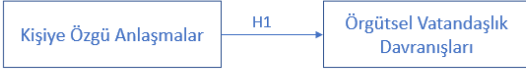
Şekil 1. Araştırma Modeli

Günümüze kadar ulusal ve uluslararası yapılan çalışmalarda kişiye özgü anlaşmalar bağımlı değişken ,iş performansı, örgütsel vatandaşlık davranışları, iş tatmini, algılanan örgütsel destek, lider üye değişimi ve turnover bağımsız değişken olarak kullanılmıştır. Bu araştırma çalışması da yer alan araştırmanın modeli, ulusal ve uluslararası yapılan literatür araştırması neticesinde benzer çalışmalarda kullanılmış değişkenler referans alınarak belirlenmiş ve kişiye özgü anlaşmalar kavramı Türkiye’de henüz yeni çalışılan bir kavram olduğu için literatüre katkı sunacağı düşünülen örgütsel vatandaşlık davranışı ile ilişkisinin incelenmesi düşünülmüştür. Araştırmanın hedefi ile uyumlu olduğu düşünülen ve belirlenen araştırma modeli Şekil 1’de belirtilmiştir.