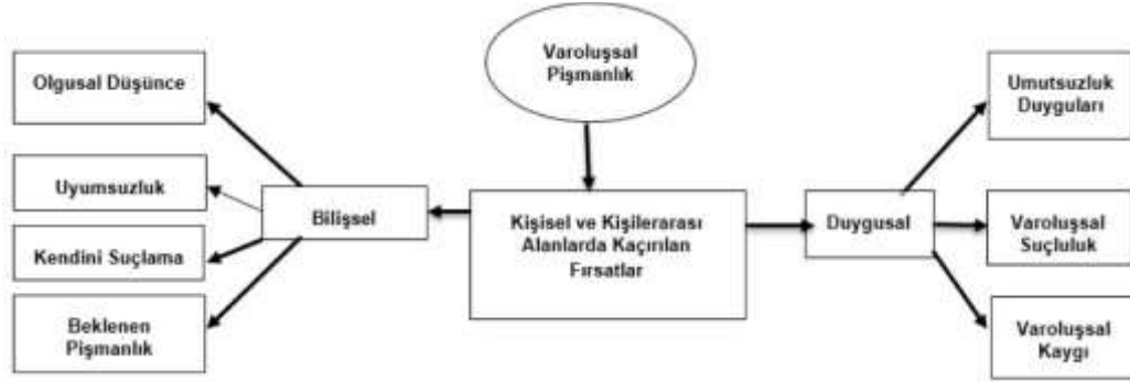
Şekil 0.1: Varoluşsal Pişmanlığın Çok Boyutlu Kavramsallaştırılmış Yapısı

Aşağıda yer alan şekil varoluşsal pişmanlığın bilişsel ve duygusal bileşenlerinin nasıl etkileştiğini, kişisel ve kişilerarası düzeyde kaçırılan fırsatların hangi duygusal sonuçlara yol açtığını göstermektedir (Reker ve Truckle, 2009; Ermiş ve Bayraktar, 2021).