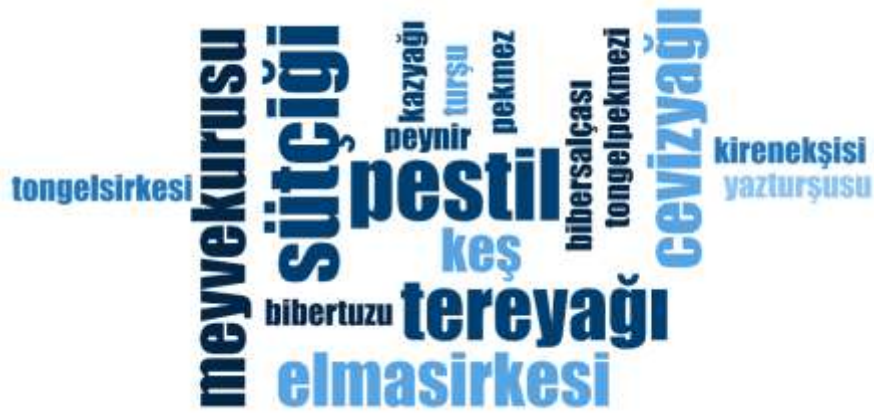
Şekil 3.19: Mevsimsel Hazırlanan Yöresel Ürünlere İlişkin Kelime Bulutu

Yemekleri hazırlamadan önce büyük emeklerle hazırlanan, yemeklerde kullanılan ürünlerin hazırlık aşamaları, yemekleri hazırlamak kadar uzun ve meşakkatli süreçten geçmektedir. Eskiden iş gücünün fazla, makine gücünün az olması her şeyi doğal ve sağlıklı kılmanın yanı sıra büyük zahmetleri de beraberinde getirebilmektedir. Zonguldak içerdiği çeşitli bitki örtüsü ve toprak yapısı ile zengin çeşitliliklere sahiptir. Hazırlık aşamalarında kullanılan bu çeşitliliğinin beraberinde getirdiği ürün zenginliği de konuşmacıların anlatımlarından yola çıkılarak söylemek gerekirse günden güne unutulmaya yüz tutmaktadır. Aşağıda Çizelge 3.29 ile Çizelge 3.34 arasında katılımcılara yönetilen “ Eskiden mevsimsel hazırlıklar nasıl ve ne şekilde yapılırdı? ” sorusuna alınan cevaplar verilmiştir. Bu çizelgelerde kullanılan ve hazırlanan ürünlere ilişkin bulgular yer almaktadır. Bölgede hemen hemen tüm yemeklere katılabilen ve yöreye özgü bir yapıyı olan sirke, neredeyse tüm katılımcıların verdikleri yöresel yemek tariflerinde de bulunan bir üründür. Aşağıda verilmiş olan Şekil 3.19’da ise yöresel ürünlerin yörede kullanımı ile ilgili kelime bulutu verilmektedir.