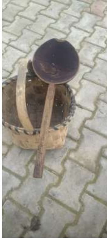
Şekil 3.26: Tahta Kepçe Örneği

Şekil 3.25'te verilmiş olan yufka, makarna gibi hamur işleri yapımında kullanılan tahta sofra örneği verilmektedir. Görsel araştırma esnasında Çaycuma ilçesinde çekilmiştir.