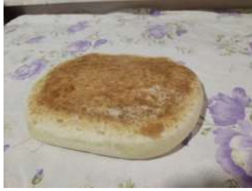
Şekil A.3: Serme