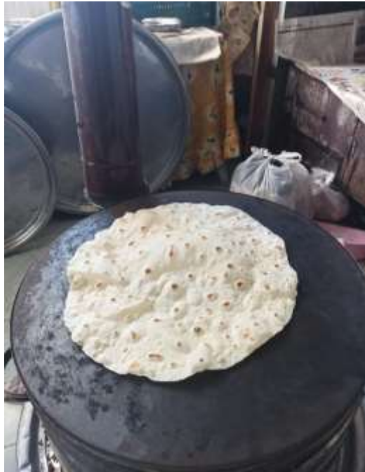
Şekil 3.9: Sac Üzerinde Kuru Yufka Yapımı

Çizelge 3.20’de verilmekte olan Zonguldak’ın et, tavuk ve balık yemeklerinin yapılarındaki yemekler içerisinde kullanılmakta olan has kokusu ile tohumlandığı zaman kullanılan kuru fesleğen gibi özgün malzemeler dikkat çekmektedir. Bölgede yapılan balık pilaki yemeği hem tatlı su hem de tuzlu su balıklarından yapılabilmektedir. Ayrıca bölgede ıslama için kullanılan kuru yufka sac yardımı ile pişirilip saklanmaktadır. Yufka örneği ve pişirilmesi aşağıdaki Şekil 3.9’da görülmektedir.