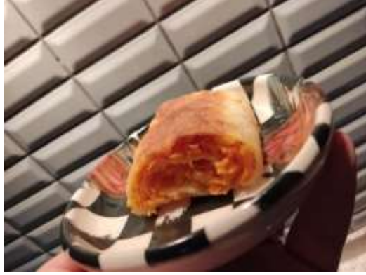
Şekil 3.13: Kabaklı Börek

adet hamur işi yapılışı ise Ek 1’de yer verilmiştir. Aşağıda verilmiş olan Şekil 3.12, Şekil 3.13 ile Şekil 3.14’te yörede sıkça yapılan hamur işi örnekleri yer almaktadır.