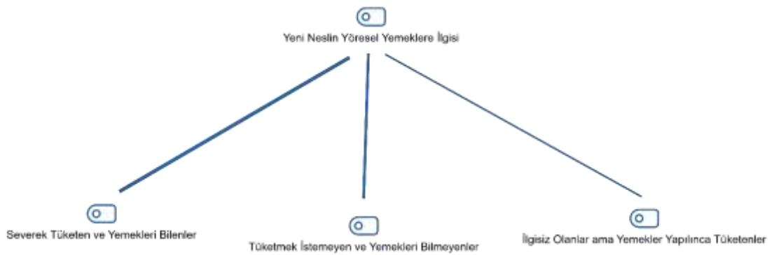
Şekil 3.18: Yeni Neslin Yöresel Yemeklere İlgisi

Yöresel yemeklerin yapımının devamlılığının sağlanıp sağlanmadığını tespit etmeye yönelik olarak yöneltilen “Geçmişte öğrendiğiniz bu tarifleri çocuklarınıza öğrettiniz mi?” sorusuna tüm katılımcılar (41) çocuklarına yöresel yemekleri öğrettiklerini belirtmişlerdir. Bununla birlikte katılımcılardan yeni neslin yemeklere olan ilgisini belirten cevaplara ulaşılmıştır. Yeni neslin yöresel yemeklere olan ilgisi ile ilişkili bulgular Çizelge 3.28 ile Şekil 3.18’de sunulmaktadır.