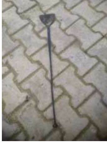
Şekil 3.27: Esran, Çevirgeç Adı Verilen Demir