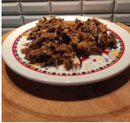
Şekil 3.11: Ispıt/Hodon

Şekil 3.10’da bölgede birçok örneği olan Kara Mancar örneği. Bölgede birçok çeşidi bilinen ve sık bir şekilde tüketilen yemeklerden biridir. Bu yemek mısır, pirinç ve bulgur gibi çeşitli tahıl ürünleri ile yapılabilmektedir. Görsel araştırma esnasında Çaycuma ilçesinde çekilmiştir.