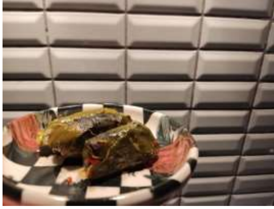
Şekil 3.12: Mancar Dolması