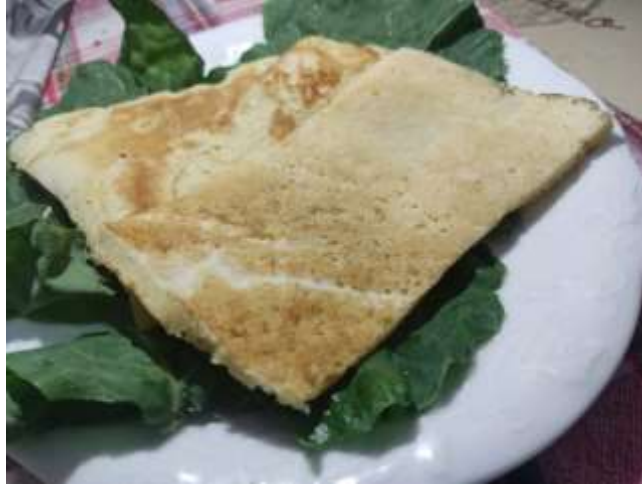
Şekil 3.15: Cızlama