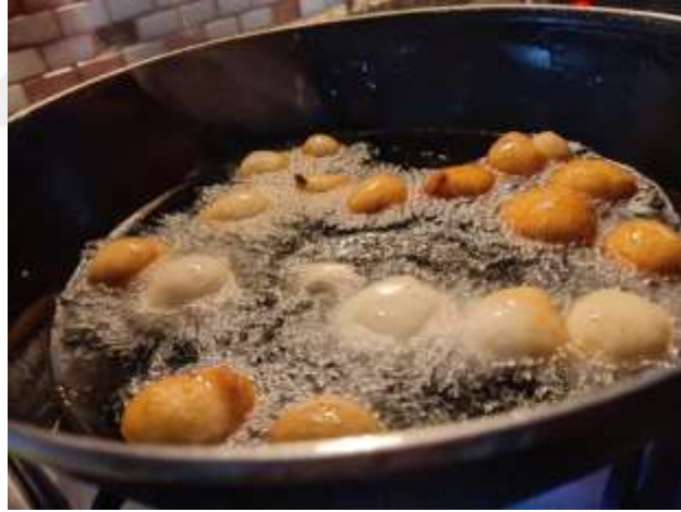
Şekil 3.14: Sade Güccek/Lokma

Şekil 3.12’te verilmiş olan Kabaklı Börek örneği, bölgede günümüzde neredeyse unutulmuş bir örnek sayılabilmektedir. Görsel araştırma esnasında Çaycuma ilçesinde çekilmiştir.