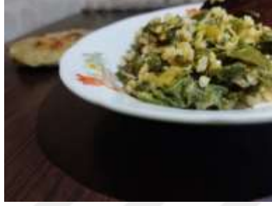
Şekil 3.10: Kara Mancar

biber, salça yerine kullanılabilen bir diğerk özgün üründür. Ürünlerin kolay ulaşılır ve genellikle doğadan toplanıp kullanılması bölgedeki eski zamanlarda yaşanmış olan fakirliğin bir diğerk göstergesi olarak değerlendirilebilir. Araştırma kapsamında tespit edilmiş olan Zonguldak yöresine ait 17 adet yöresel sebze yemeğinin yapılışı ise Ek 1’de yer verilmiştir. Aşağıda yer alan Şekil 3.10 ile Şekil 3.11’de yörede fazlaca yapılan sebze yemeği örnekleri verilmektedir.