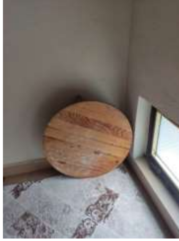
Şekil 3.25: Yufka Açmak İçin Sofra Örneği