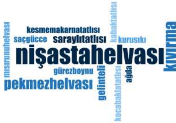
Şekil 3.8: Zonguldak İli Yöresel Tatlı İsimleri Kelime Bulutu

sofralarda tüketilmediği bayram gibi özel günlerde çocuklara hediye olarak verildiğinde bilinmektedir. Örnekleri verilen sütliye çeşitleri, hoşaf çeşitleri genellikle ana yemekten sonra tüketilmektedir. Aşağıda sunulan Şekil 3.7’de ise Zonguldak iline ait yöresel tatlı isimlerine ilişkin kelime bulutuna yer verilmektedir.