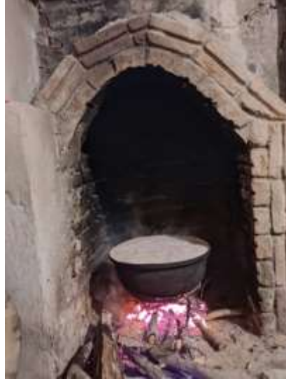
Şekil 3.30: Kara Ocak Örneği

Şekil 3.29'da verilmiş olan yemek kabı örneği eski zamanlarda yemeklerin tüketilmesinde kullanılmaktadır. Görsel araştırma esnasında Devrek ilçesinde, Devrek kent müzesinde çekilmiştir.