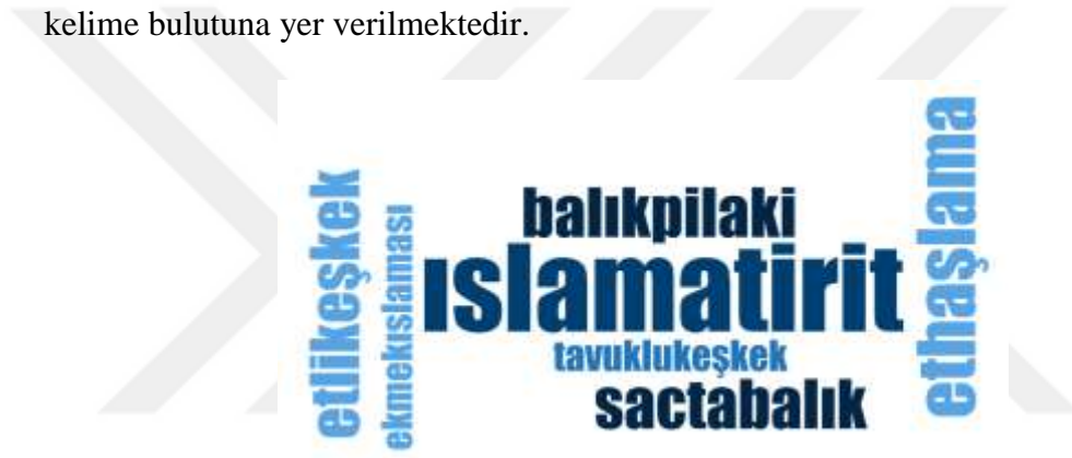
Şekil 3.2: Zonguldak ili Yöresel Et, Balık, Tavuk Yemekleri İsimlerine ilişkin Kelime Bulutu

Zonguldak'ın yöresel çorba isimlerinin verilmiş olduğu Çizelge 3.4'de "Arapaşı Çorbası (1), Barbunyalı Mancar Çorbası (1), Düğün Çorbası (1), Garaşaşuran (1), İşkembe Çorbası (1), Paça Çorbası (1), Şehriye Çorbası (1), Uğmaç Çorbası (1) ve Yoğurt Çorbası (1)" isimli çorbaların yörede günümüzde fazla yapılmadığı dikkat çekmektedir. Bu durum mutfak kültürü özelinde Zonguldak'ta yöresel yemeklerin azalmasının bir göstergesi olarak değerlendirilebilir. Ayrıca yöre halkı tarafından bilinen ve çokça yapılan Mısır/Göce çorbası bölgede çok tüketilen kurutulmuş mısırdan yapılmaktadır. Bölgede ünü olan kiren ve kestane gibi yabancı meyvelerin de çorba yapımında kullanılması bir diğer özellik olarak göze çarpmaktadır. Ayrıca kiren bölgedeki coğrafi işaretli ürünlerden biridir. Aşağıda sunulan Şekil 3.2'de ise Zonguldak iline ait et, tavuk ve balık yemeklerine ilişkin kelime bulutuna yer verilmektedir.