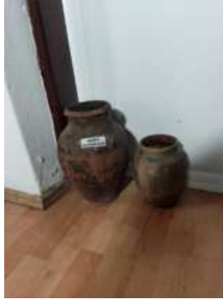
Şekil 3.20: Devrek'teki Sirke Küpü Örnekleri