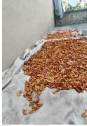
Şekil 3.21: Elma Kuruşu Örneđi

saklama yöntemlerinden biri olarak görülen pestil yapımı ve ürün kurutma yöntemi önemini oldukça vurgulamaktadır. Aşağıda yer alan Şekil 3.21’de elma kuruşu örneđi verilmektedir.