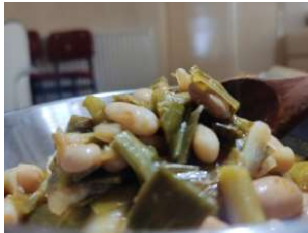
Şekil A.1: Baklalı Pırasa