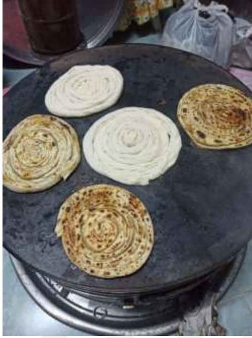
Şekil A.5: Saraylı