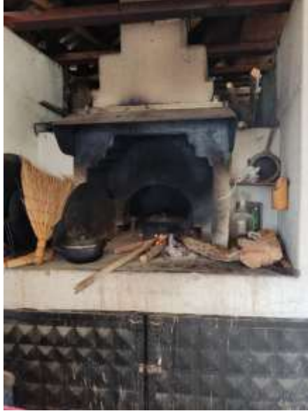
Şekil 3.32: Kara Ocak Örneği

Şekil 3.31’de verilmiş olan malay dayağı örneği bölgede malay yemeği yapımı için özel olarak kullanılan bir ekipman niteliğindedir. Görsel araştırma esnasında Çaycuma ilçesinde çekilmiştir.