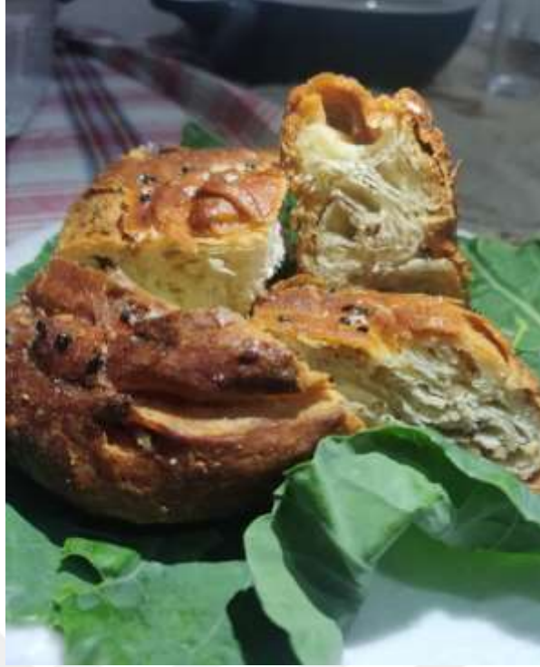
Şekil A.2: Cevizli Kömeç