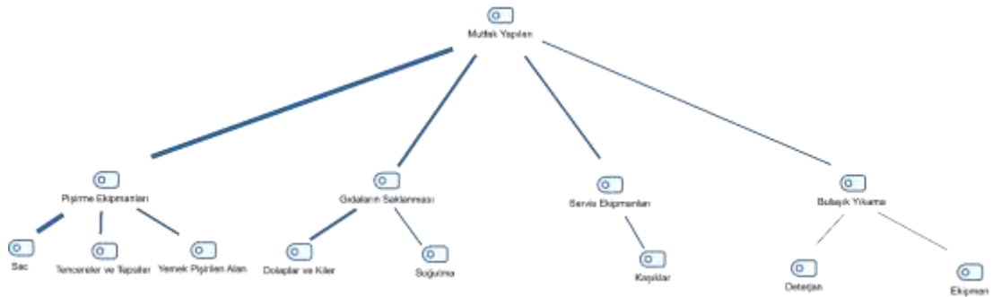
Şekil 3.22: Mutfak Yapıları

Katılımcılara sorulan sorular arasında mutfak mimarisini öğrenmek için yöneltilen “ Eski mutfakların mimari yapısı nasıldı? ” ve “ Eski mutfaklar içerisinde kullanılan araç ve gereçler nelerdir? ” sorularına alınan cevaplar Çizelge 3.38’de verilmiştir. Şekil 3.22’de ise konu ile ilgili oluşturulmuş kod haritası verilmektedir.