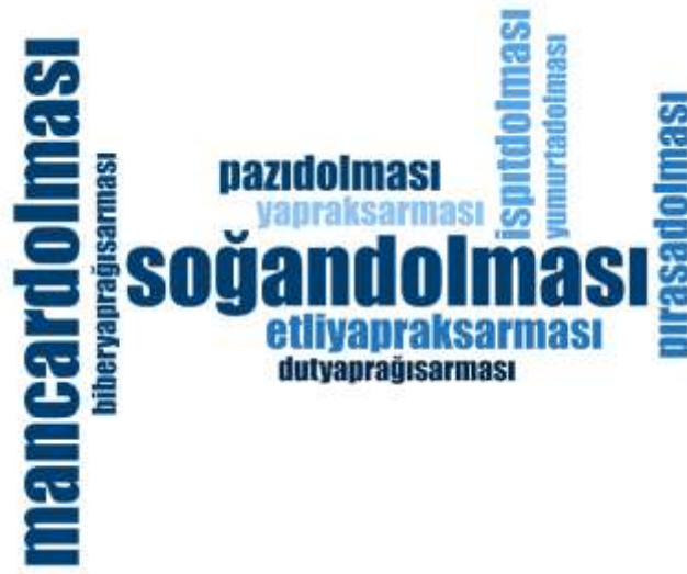
Şekil 3.4: Zonguldak ili Yöresel Dolma Çeşitleri İsimlerine ilişkin Kelime Bulutu

Şekil 3.4'teki kelime bulutunda aşağıdaki Çizelge 3.6'da verilen yöresel dolma çeşitleri verilmiştir. Şekil incelendiğinde yörede en fazla yapılan yöresel dolmalar sırasıyla “Soğan Dolması (9)” ve “Mancar Dolması (8)” olduğu sonucuna ulaşılmıştır. Çizelge 3.6'da Zonguldak'ın dolma çeşitlerinin toplamda 10 adet dolma çeşidinin olduğu tespit edilmiştir. Bu dolma çeşitleri Zonguldak mutfak kültüründe servis edilen dolma çeşitleridir. Mancar dolmasının yörede en fazla bilinen ve yapılan dolma olması Mancar'ın bölge için önemini gösteren bir diğer unsurdur. Karalahana için kullanılan bir isim olan Mancar bölgedeki çoğu yöresel üründe kullanılmaktadır. Dolma çeşitleri arasındaki özgün olan dut yaprağı sarması ve biber yaprağı dolması gibi dolmalar Zonguldak mutfak kültürünün özgünlüğünü göstermektedir. Ayrıca yörede yapılan soğan dolmasının diğer yörelerde yapılan soğan dolmasından ayıran özelliği ise çeşitli meyve sirkeleri ile yapılmasıdır.