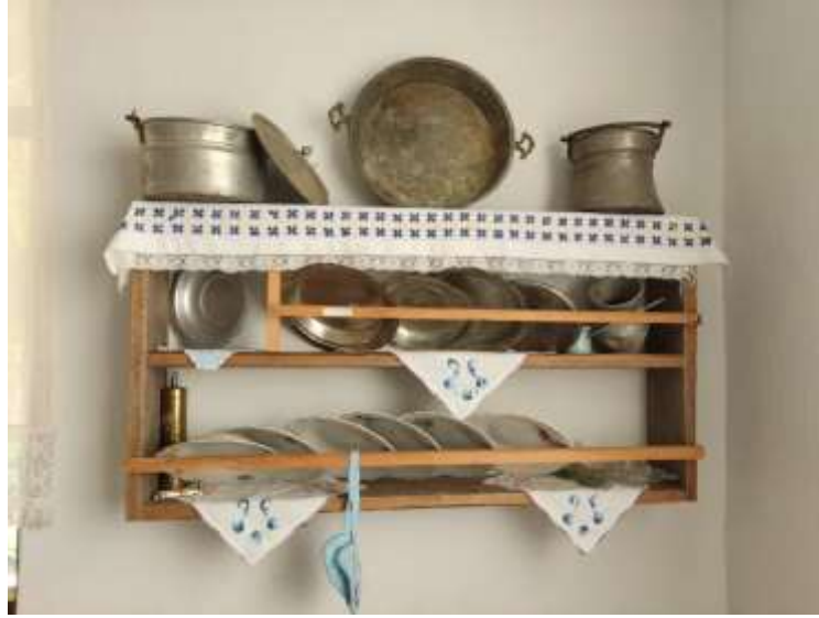
Şekil 3.24: Mutfak Rafı

Şekil 3.23'te verilmiş olan taş sac örneği verilmektedir. Görsel araştırma esnasında Çaycuma ilçesinde çekilmiştir.