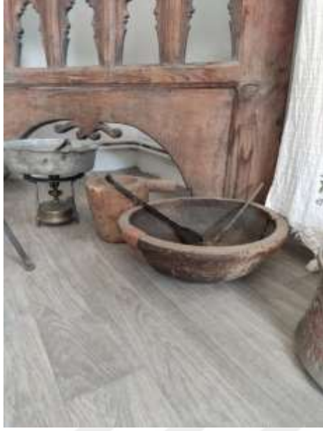
Şekil 3.29: Yemek Kabı Örneği