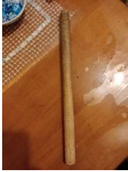
Şekil 3.31: Malay Dayağı Örneği