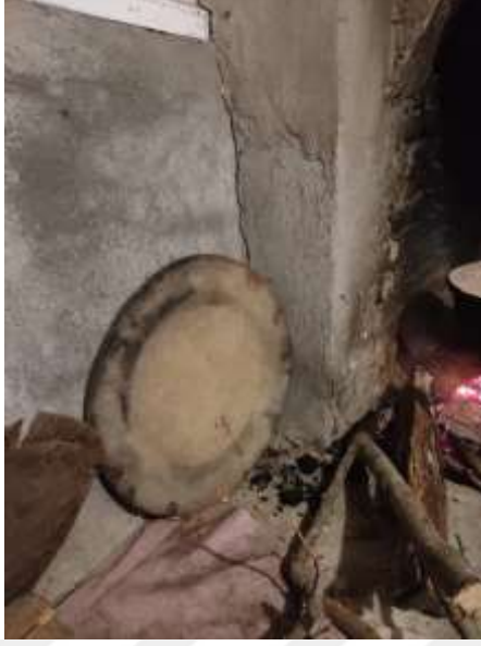
Şekil 3.23: Sac Örneği

gereçler nelerdir? Farklı isimler ile kullanılan mutfak araç gereçlerine örnek verebilir misiniz?” sorusuna cevaben alınan araç ve gereç örnekleri verilmektedir.