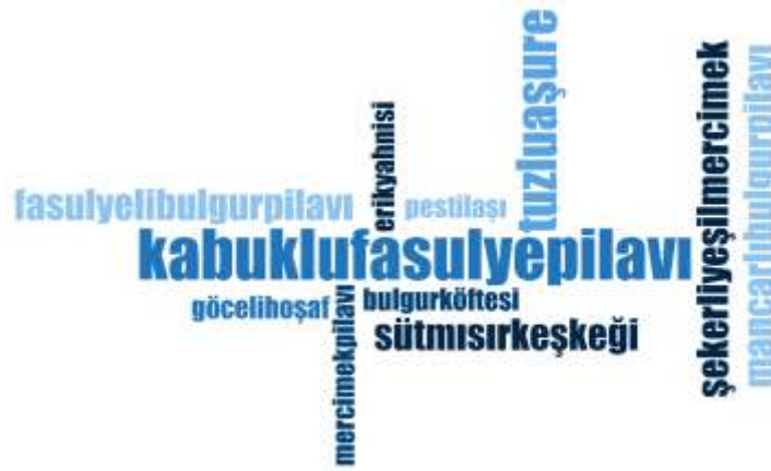
Şekil 3.6: Zonguldak'ın Tahıllı ve Bakliyatlı Yöresel Yemeklerine İlişkin Kelime Bulutu

Şekil 3.6'daki kelime bulutunda aşağıdaki Çizelge 3.8'de verilen yöresel bakliyat ve tahıl yemekleri verilmiştir. Şekil incelendiğinde yörede en fazla yapılan yöresel tahıl ve bakliyat yemekleri sırasıyla “Kabuklu Fasulye Pilavı (4)” ve “Tuzlu Aşure (3)” olduğu sonucuna ulaşılmıştır. Yörede aşure, sütlaç gibi tatlı olarak bilinen yöresel yemeklerin tuzlu, yeşil mercimek gibi tuzlu olan yemeklerin ise tatlı olarak yapıldığı tespit edilmiştir. Bu durum yöre mutfağındaki özgünlüğü göstermektedir. Çizelge 3.8'de toplamda 11 adet bakliyat ve tahıl yemeği ismi verilmiştir. Bu yemekler Zonguldak mutfak kültüründe servis edile tahıl ve bakliyat yemekleridir.