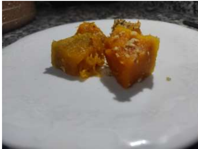
Şekil A.6: Kabak Tatlısı