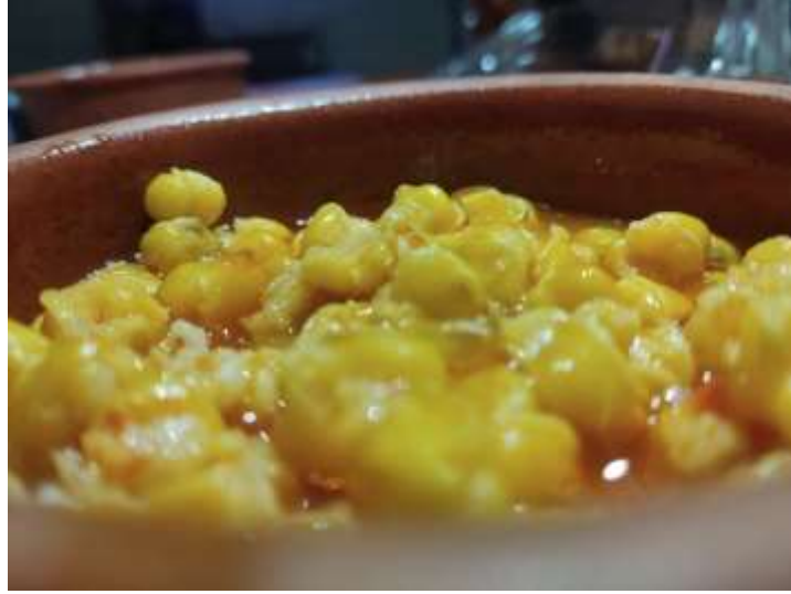
Şekil A.4: Süt Mısır Keşkeği