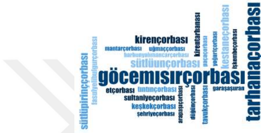
Şekil 3.1: Zonguldak ili Yöresel Çorba Çeşitleri İsimlerine İlişkin Kelime Bulutu

yemekleri/yardımcı yemekler ve tatlılar olarak sınıflandırılmıştır. Zonguldak genelinde 142 adet yemek tespit edilmiştir. Aşağıda sunulan çizelgede Zonguldak'ta yapılan yöresel yemekleri gün yüzüne çıkarmak adına sorulmuş olan “Çocukluğunuzdan itibaren yapılan yöresel yemekler nelerdir?” sorusuna verilen yemek isimleri yer almaktadır. Çizelge 3.3 ile Çizelge 3.10 arasında yemek isimleri sunulmakta olup her bir çizelgenin üstünde ise MAXQDA programı ile oluşturulmuş yemeklerle ilgili kelime bulutları verilmektedir.