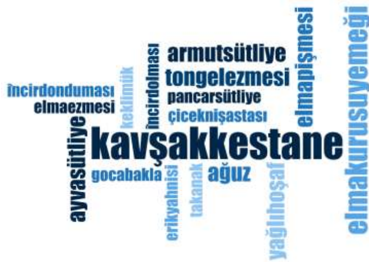
Şekil 3.7: Zonguldak ili Yöresel Meyveli ve Yardımcı Yemeklerine İlişkin Kelime Bulutu

Şekil 3.7’deki kelime bulutunda aşağıdaki Çizelge 3.9’da verilen yöresel meyve ve yardımcı yemek isimleri verilmiştir. Şekil incelendiğinde yörede en fazla yapılan yöresel meyve ve yardımcı yemekler sırasıyla “Kavşak Kestane (5),” ve “Şippili (3),” olduğu sonucuna ulaşılmıştır. Çizelge 3.9’da toplamda 17 adet meyve ve yardımcı yemek olduğu tespit edilmiştir. Yörede en fazla bilinen kara fırında kurutulmuş kestanenin kışlık olarak saklanması ile elde edilen kavşak kestane yemeği kullanılmadan bir gün önce ıslanması ile yapılmaktadır. Kestane yörede sıkça kullanılan değerli ürünlerden biridir. Yemek çeşitlerindeki kullanılan çeşitli meyveler Zonguldak yemeklerindeki özgünlüğü ifade etmektedir.