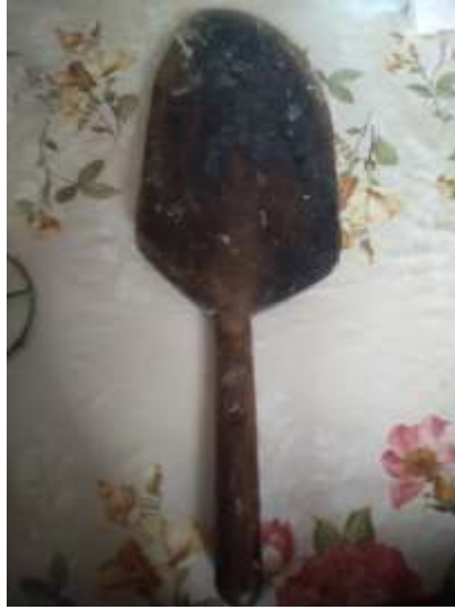
Şekil 3.28: Pislac Örneği

Şekil 3.27’de verilmiş olan esran, çevirgeç gibi isimlerle anılan, saç üzerinde yufka, cizleme gibi ürünlerin çevrilmesi için kullanılan demir örneği verilmektedir. Görsel araştırma esnasında Alaplı ilçesinde çekilmiştir.