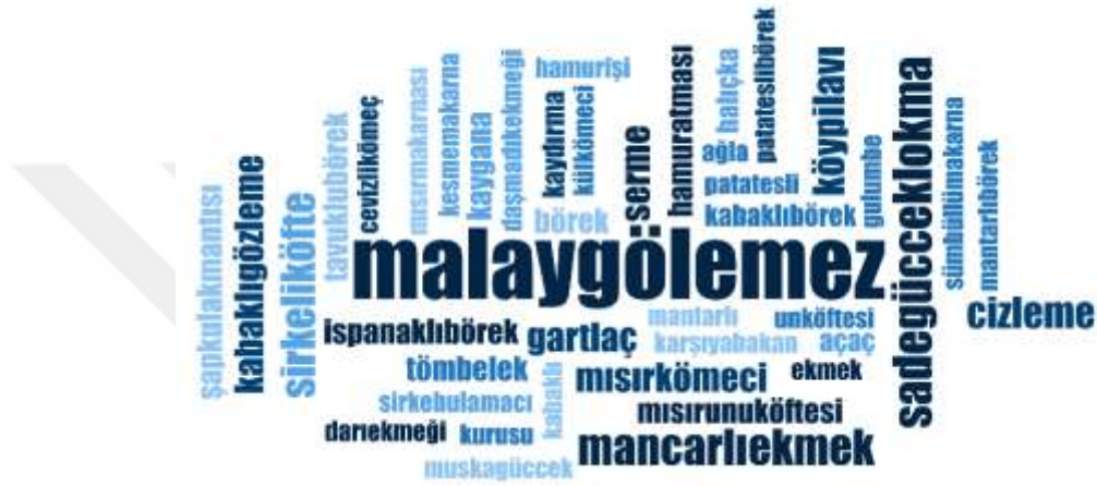
Şekil 3.5: Zonguldak ili Yöresel Hamur İşleri İsimlerine ilişkin Kelime Bulutu

olma özelliğini taşıyan Zılbıt gibi isimlerle anılan bitkinin taze yapraklarından yapılmasıdır. Dolma taze yapılabildiği gibi yapraklar kurutulup saklanarak yapılabilmektedir. Bölgeye özgü bir diğer dolma etli yaprak sarmasıdır. Bu sarma çok küçük bir şekilde lokmalar halinde sarılarak yapılmaktadır. Az bilinen bu dolma çeşitleri bölgede gastronomi turizmi özelinde kullanılabilir olan özgün dolma çeşitleridir. Turizmin kalkınması anlamında şehir genelinde bu az bilinen yemeklere sahip çıkılması gerekmektedir. Aşağıda sunulan Şekil 3.5’te ise Zonguldak iline ait yöresel hamur işlerine ilişkin kelime bulutuna yer verilmektedir.