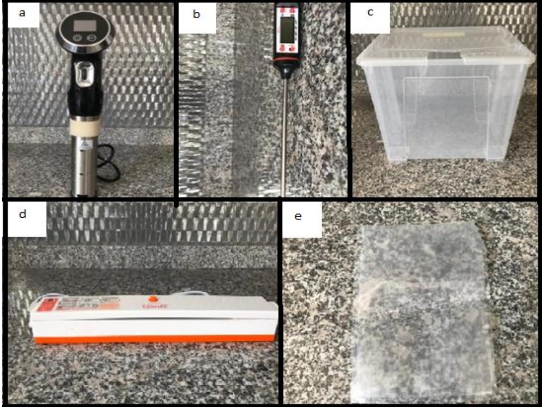
Şekil 2.1: Sous vide tekniğinde kullanılan ekipmanlar; a) Sous vide makinası b) Termometre c) Su küveti d) Vakum makinası e) Vakum poşeti

Sous vide tekniğinde ürünü piştirme işlemini gerçekleştiren makina, sous vide makinasıdır. Sous vide makinasının çalışma prensibi ise hazırlanan su banyosuna sous vide cihaz probunun daldırılması ve sistemin çalıştırılmasıdır. Bu sistemde vakumlanmış ürün su banyosunda istenilen sıcaklığa ulaşırken bir yandan da haznede yer alan su sirküle edilerek ısı dağılımının homojen olması sağlanır. Sous vide tekniğinin uygulandığı bir diğer makine de buhar fırınlardır. Konveksiyonel buharlı fırınlarda özel bir hazneye su eklenmekte ve elde edilen buhar vasıtasıyla ürün istenen şekilde pişirilebilmektedir. Bu sistemlerin dışında tencere formunda, kendinden hazneli, istenilen sıcaklığa ayarlanıp süre ayarı yapılabilen cihazlar da mevcuttur. (Baltalı, 2019).