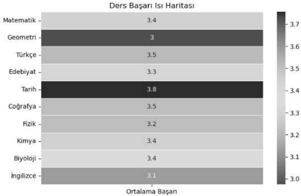
Şekil 4.1: Öğrencilerin temel derslerdeki başarı düzeylerini gösteren ısı haritası

Bu bölümde, öğrencilerin temel derslerdeki (Matematik, Türkçe, Türk Dili ve Edebiyatı, Coğrafya, Fizik, Kimya, Biyoloji, İngilizce vb.) dönemsel başarı puanları kullanılarak oluşturulan ısı haritası sunulmuştur; ayrıntılar Şekil 4.1’de gösterilmiştir.