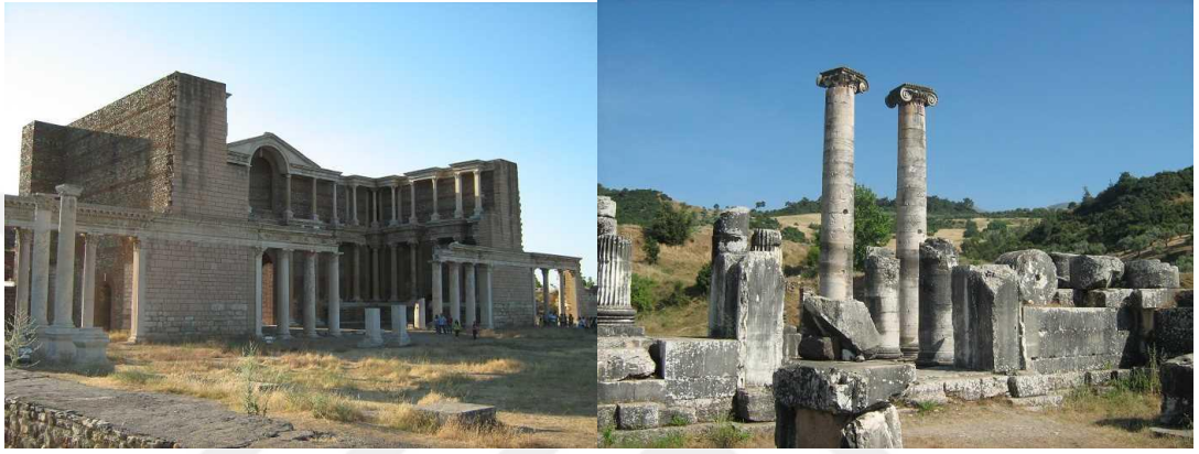
Şekil 3.3: Sardes Harabeleri

Sardes Harabeleri (Şekil 3.3): Bu harabeler Lidya'nın başkenti olan Sard şehrine ait olup, Salihli ilçesinin Mustafa Bey köyünde yer almaktadır. Milattan önce 2000'lerde kurulan bu şehrin ancak bir kısmı ortada olup, büyük bir kısmı toprak altındadır (Manisa Valiliği, 2012).