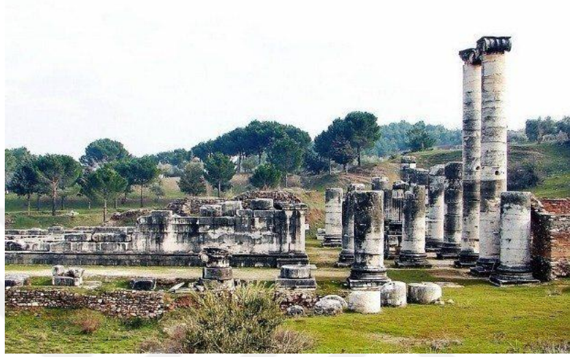
Şekil 3.5: Artemis Tapınağı

Artemis Tapınağı (Şekil 3.5): Helenistik dönemde yapılmaya başlanan tapınağın Kibele kültürünün kutsal alanında bulunduğu düşünülmektedir. Tanrıca Artemis adına yaptırılan tapınak cellası (hristiyan ibadethanelerinde bir mimari bölüm) dört bölümden oluşmaktadır. Sütunlarının her biri 20 ton ağırlığa ve 17,31 m'ye ulaşmaktadır (Manisa Valiliği, 2012).