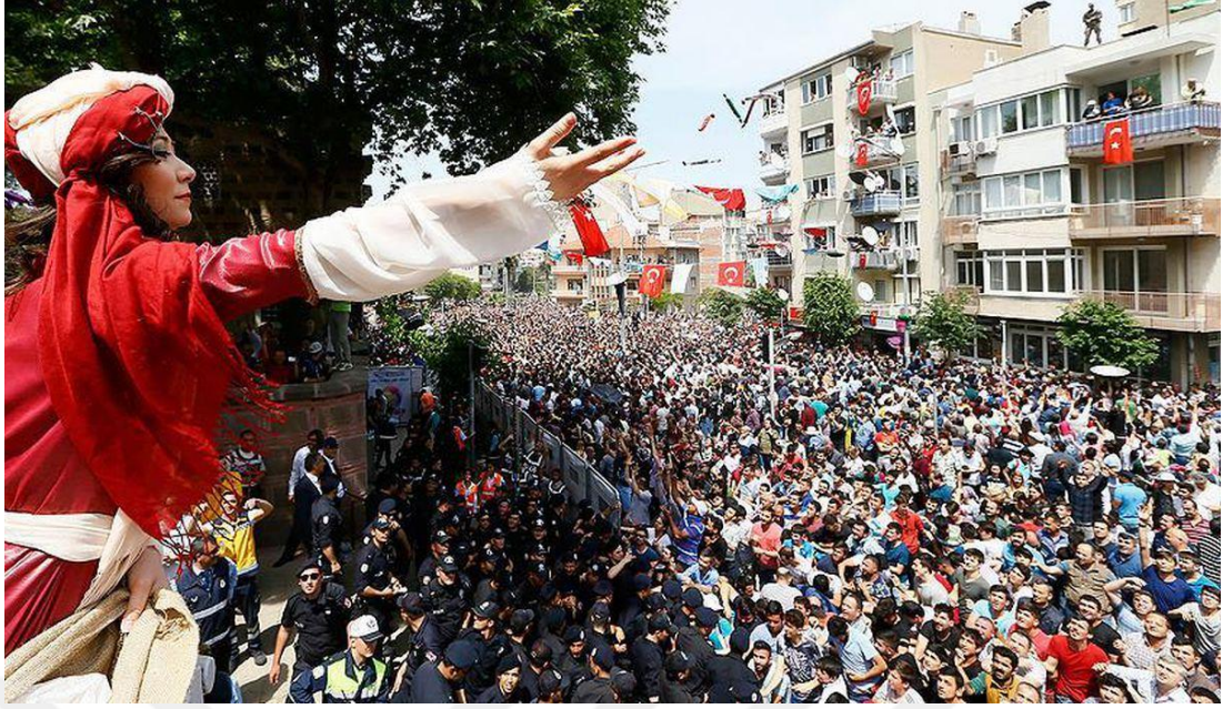
Şekil 3.8: Mesir Macunu Festivalinde Macun Saçılması