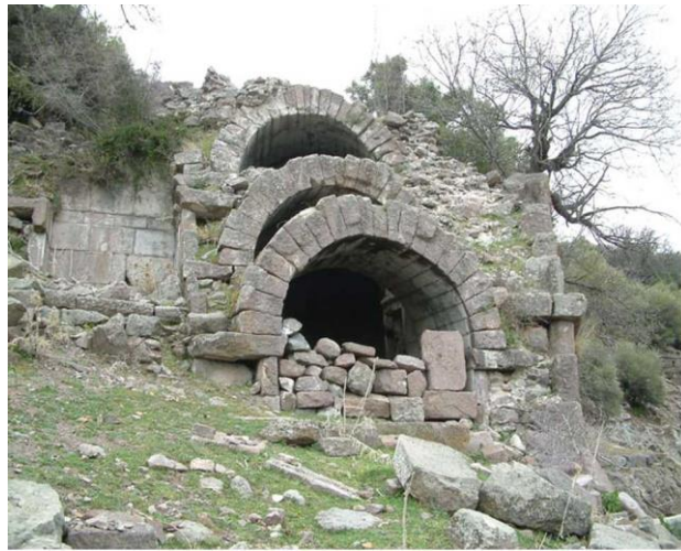
Şekil 3.4: Aigai Harabesi

Aigai Harabesi (Şekil 3.4): Manisa şehrinin batısında bulunan Köseler köyüne yakındır. Bergama Krallığı'nda önemli yer tutan Aigai şehrinin kalesidir. Denizden 360 m yükseklikte bir volkanik bir tepenin üstünde kurulmuştur (Manisa Valiliği, 2012).