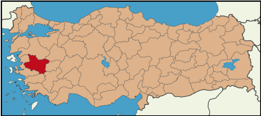
Şekil 3.1: Manisa'nın Türkiye'deki Konumu

71 metre yüksekliğe sahip olan ilde en yüksek merkezi nokta 1513 m yüksekliğindeki Spil Dağı olup, merkez dışında bu 2070 m ile Salihli Bozdağlar Kumtepe'dir. İlçe merkezlerinde ise 850 m ile en yüksek ilçe merkezini Demirci İlçesi oluşturmaktadır. İdari açıdan güneydoğudan Denizli, güneyden Aydın, kuzeyden Balıkesir, batıdan İzmir ve doğudan Kütahya ve Uşak ile çevrili olan şehrin yüz ölçümü 13.810 km 2 'dir (T.C. Çevre ve Şehircilik Bakanlığı, 2017). Şekil 3.1'de Manisa şehrinin Türkiye haritasındaki yeri gösterilmektedir.