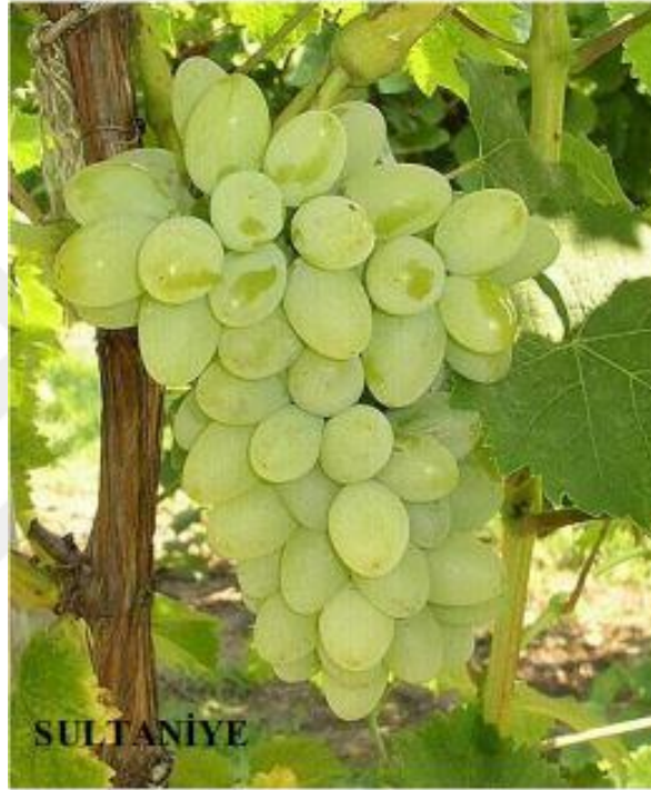
Şekil 3.9: Sultaniye Üzümü

maddiyat ya da mesafeleri önemsemeyen, şarap sever turistler olduğunu belirlemiştir. Bu kişilerin ağırlıklı olarak Kula'ya dair şarap turizmi deneyimi öncesinde düşük beklentiye sahip olduğunu ve Kula'nın beklentileri karşılayacağına inanmadıkları algısına sahip olduklarını belirlemiştir. Ancak Kula'yı ziyaret ettikten sonra turistlerin beklenenin çok üstünde bir ürün ve hizmet kalitesiyle karşılaştığı; konaklama, yemek yeme açısından da tatmin olduklarını belirlemiştir. Bu bağlamda Manisa'da şarap yapımında kullanılan Sultaniye üzümünün yetiştirildiği bölgelerin şarap turizmi açısından daha fazla tanıtılması gerektiği düşünülmektedir.