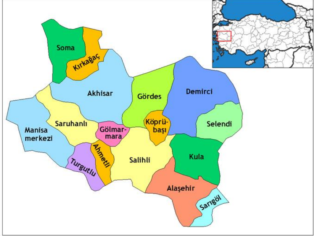
Şekil 3.2: Manisa İlçeleri

Manisa’da merkez ilçeyle birlikte 16 ilçe, 74 belediye, 779 köy ve 493 köy altı yerleşim birimi bulunmaktadır (Şekil 2.2). Komşu illere olan uzaklıkları ise Uşak 193 km, Kütahya 316 km, İzmir 36 km, Denizli 206 km, Balıkesir 137 km ve Aydın 156 km şeklindedir (T. C. Çevre ve Şehircilik Bakanlığı, 2017). Şekil 3.2’de Manisa yerleşim planı sunulmuştur.