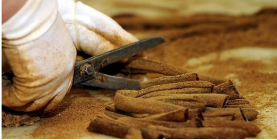
Şekil 3.7: Mesir Macunu

ve şeker katılarak pişirilmesi sonucunda belirli bir kıvama getirilen geleneksel bir gıda maddesidir. Katkı maddeleri olarak koyulaştırıcı, asitlendirici ve tatlandırıcı gibi TSE özel mevzuatında yer alan maddeler kullanılabilir (Güven, 2010).