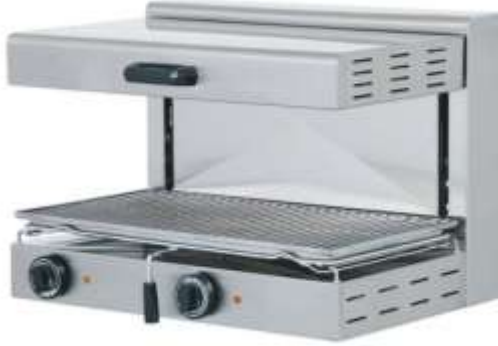
Şekil 2.3: Salamander (Broiler)

Kısa süreli bir pişirme tekniği olduğu için genellikle yumuşak etlerde uygulanmaktadır. Ürün ısı kaynağının altında olursa Broiling , üstünde olursa Grilling olarak adlandırılmaktadır. Mutfaklarda Broiling tekniğini uygulamak için “Salamander” adlı makineler kullanılmaktadır (Gökdemir, 2003; Öney, 2010).