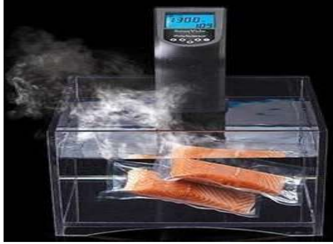
Şekil 2.2: Sous Vide Tekniğinde Kullanılan Su Banyosu ve Sirkülatör Cihazı