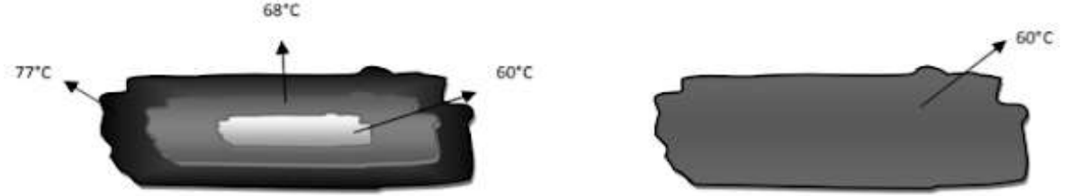
Şekil 1.1: Geleneksel ve Sous Vide Pişirmede Oluşan Sıcaklık Dağılımları