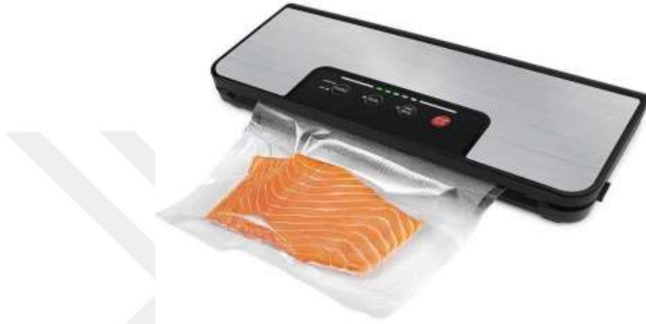
Şekil 2.1: Sous Vide Tekniğinde Kullanılan Vakumlama Makinesi Örneği

vakumlanmaya dayanıklı, polimer bileşiklerin migrasyonu kabul edilebilir seviyede, gıdaya uygun olmaları gerekmektedir (Yan, 2011). Aynı zamanda, ambalajın esnek olması, ısıtma ve soğutma işlemleri sırasında kendi ve ürünün şeklinin bozulmamasını sağlamaktadır. Et gibi katı ürünlerin vakumlama işleminde düşük basınç değerlerine ulaşması, sıvı ürünlere kıyasla daha kolay gerçekleşmektedir (Debaerdemaeker ve Nicolai, 1995). Sous vide vakum makineleri örnek görselleri aşağıda verilmiştir.