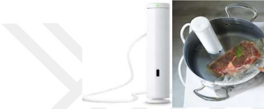
Şekil 3.1: ChefSteps Joule Sous Vide Hassas Pişirici Wi-fi 1100W-220V

Kullanılan Cihaz: Pişirme işlemleri Chefsteps Joule Sous Vide Hassas Pişirici Wifi 1100W-220V cihazı kullanılarak yapılmıştır.