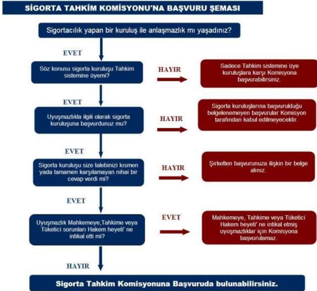
Şekil 4.1: Sigorta Tahkim Komisyonu'na Başvuru Şeması

Komisyon'a başvuru şeması aşağıda verilmiştir 386 ;