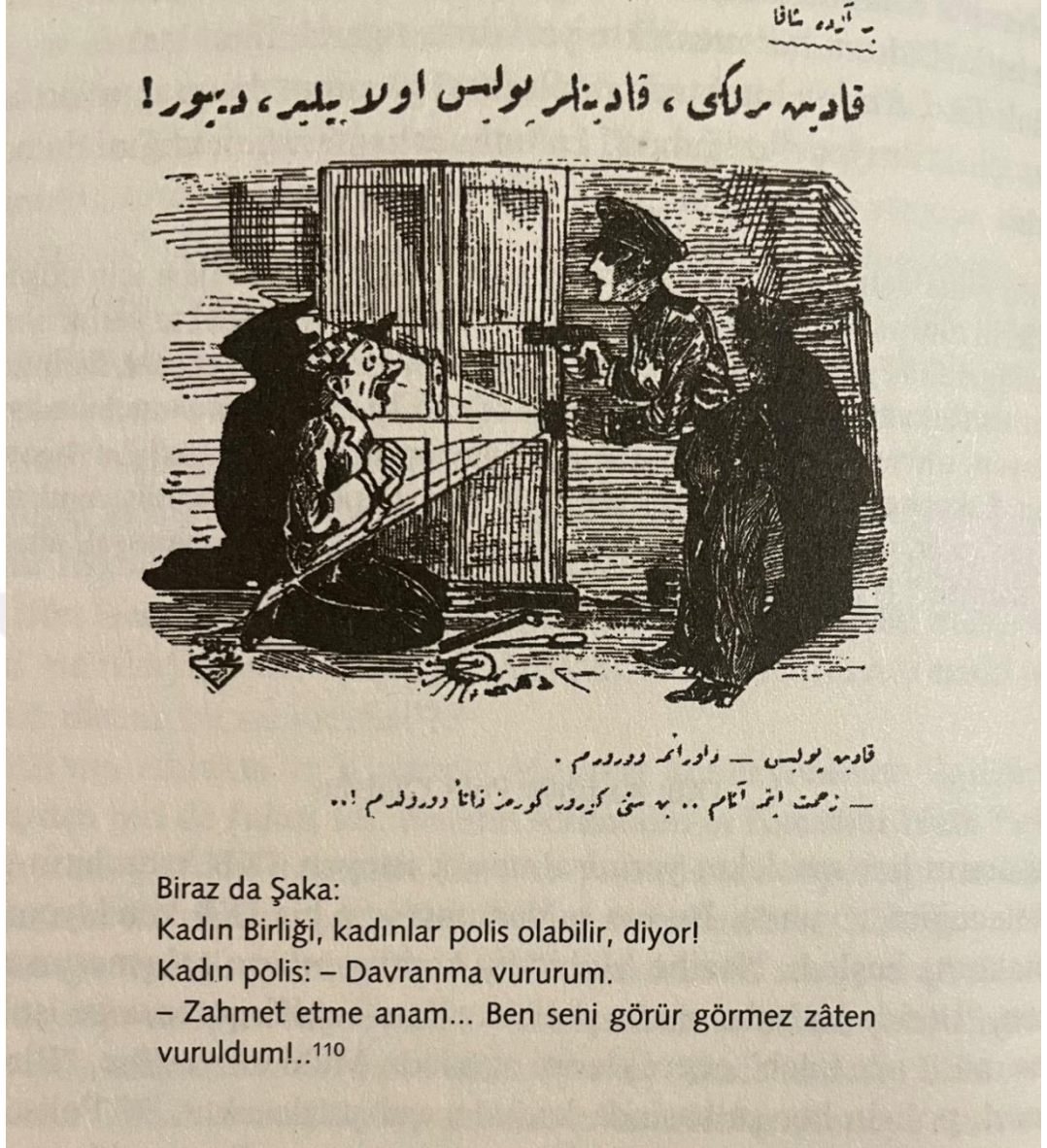
Şekil 4.4: “Biraz da Şaka: Kadın Birliği Kadınlar Polis Olabilir Diyor!” Başlığıyla Yayımlanan Karikatür