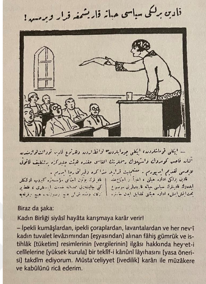
Şekil 4.1: “Biraz da Şaka: Kadın Birliği Siyasi Hayata Karışmaya Karar Verir!” Başlığıyla Yayımlanan Karikatür