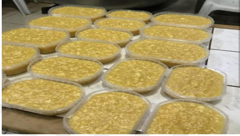
Şekil 2.6: Höşmerim Tatlısı

iklimi ve tarımsal şekli çok farklı türde yemeklerin yörede yapılabileceğini göstermektedir. Kuna, kalamar dolması, balıklı bamya, saçaklı mantı, hoşmerim lezzetine bakılabilecek sayılı yemeklerden bazıları olarak gösterilebilir (T.C. Balıkesir Valiliği, 2020).