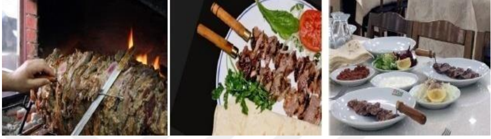
Şekil 2.12: Cağ Kebabı

Cağ Kebabı : Kemiğinden ayrılmış et parçaları el büyüklüğünde parçalar şeklinde doğranır ve düz bir yere serilerek üzerine tuz ilave edilir. Bir kabın içerisinde ince kıyılmış kuru soğanlar etlerin üzerine eklenerek hamur yoğurur şekilde elle sıkılır ve böylece tuz ile soğan ete iyice yedirilmiş hale getirilir. Bir süre buzdolabında dinlendirildikten sonra şişe geçirilerek pişirmeye başlanabilir. Servis edilirken mevsim salata, acılı ezme, süzme yoğurt, közlenmiş biber de verilmektedir (Polat Üzümcü ve Denk, 2019).