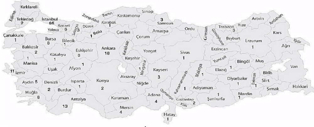
Şekil 2.4: 2014 Yılına Ait Türkiye’de İller Bazında Mcdonald’s Restoranı Sayıları