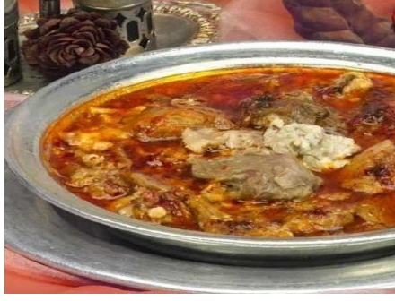
Şekil 2.13: Beyran