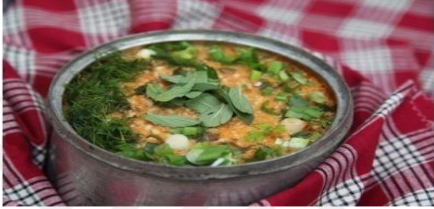
Şekil 2.9: Ekşili Pilav

başlanmadan önce yıkama işlemi yapılmış siyez bulguru kaynayan karışıma ilave edilir. Tuz ekledikten sonra, dereotu, asma yaprağı, taze nane, ısırgan otu, ebegümece ve yeşil soğandan oluşan bütüm otlar yıkanıp doğranarak tencereye katılır. Karışım piştikten sonra ocaktan alınmadan ayran eklenir ve kaynayana kadar karıştırılmaya devam edilir, ocaktan alınır. Bir tavada tereyağı eritilerek pul biber ve karabiber eklenir. Bu karışım tencereye ilave edilir. Ayranın miktarı ekşiliğin durumuna göre değiştirilebilir. 2-3 dakika dinlendirildikten sonra servis edilir (Yüce, 2018).