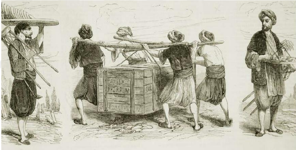
Şekil 2.2: Çörekçi, Hamal ve Şekerci

Osmanlı Saray Mutfağı'na Matbahı Amire ismi verildiği bilinmekle beraber, Matbah-ı Amire aslında bir mutfak değil, bünyesinde farklı mutfaklar, helvahane, kiler, fırınlar, miri mandıra ve simithaneyi bünyesinde bulunduran idari kurumun ismidir (Hatipoğlu ve Batman, 2014). Saray mutfakları birbirine benzer on bölümden oluşmaktadır. Güneyden başlayarak Hassa, yeni padişahın kişisel mutfağı, Valide Sultan mutfağı, hasekiler ve diğer kadınlar mutfağı, kapıağası mutfağı, Divan-ı Hümayun mutfağı, enderun ağaları mutfağı, erkek ve kadın hizmetkarların ve Divan memurlarının mutfağı şeklinde sıralanmaktadır. Birbiriyle bağlantılı son iki bölmede şekerciler yer almaktadır (Yerasimos, 2002). 19. yüzyılda İstanbul'da yemeklerin üretim ve satışı ile ilgilenen çok sayıda esnaf bulunmaktadır. Bu esnaflara örnek olarak Şekil 2.2'de soldan sağa çörekçi, hamallar ve şekerci gösterilmiştir.