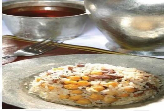
Şekil 2.11: Kabune Pilavı

Kabune Pilavı: Soğan halka halka doğandıktan sonra karabiber ve tuz ile ovulduktan sonra bakır bir kazanın alt kısmına konulur. Ardından üstüne haşlanmış nohut ilave edilir. Nohudun üzerine de daha önceden hazırlanmış, haşlanmış kuzu eti didilerek döşenir. Daha sonra üzerine önceden ıslatılmış pirinç eklenerek, et suyu ilave edilir. Yüksek ateşte 15 dakika pişmesi sağlanır. Suyu çekmiş ve yeterince pişmiş pirincin üzerine ocaktan alınmadan önce kızartılmış tereyağı ilave edilir. Ocaktan alınarak dinlenmeye bırakılır. Yeterince büyük bir servis tepsisine tencere ters çevrilerek boşaltılır. Tencerenin dibindeki et ve nohut üst kısımda görünecek şekilde karabiber ilave edilerek servis edilir (T.C. Kültür ve Turizm Bakanlığı, 2020ç).