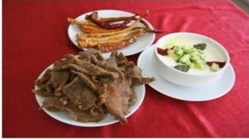
Şekil 2.5: Edirne Tava Ciğer

başında tava ciğeri gelmektedir. Edirne ilinde yetiştirilen büyükbaş hayvan dananın ciğeri kullanılarak hazırlanmaktadır (Çakır ve diğ., 2017).