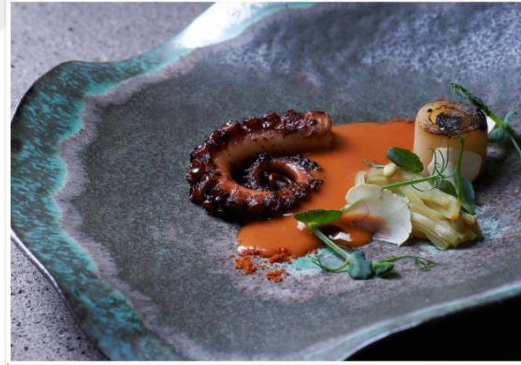
Şekil 2.14: Fine Dining Restoran Yemeği

ortaya koymaktadır (Cracknell ve Nobis, 1989). Yemek ile ilgili konularda yazarlık yapan Menon, Nouveau Traite De La Cuisine adlı kitabının 1742 yılındaki baskısında yeni mutfak şeklinde isimlendirilen nouvelle cuisine kavramını kullanan ilk yazar olmuştur. (Aksoy ve Üner, 2016). Nouvelle cuisine , son derece yüksek kaliteli ve maliyetli yemeklerin hazırlanmasına yoğunlaşmaktadır. Geleneği tamamen terk etmeden yeni ve heyecan verici yemek kombinasyonlarını denemesini sağlar. Ortaya çıkan yemekler şaşırtıcı ve alışılmıştın dışındadır (Cracknell ve Nobis, 1989). 1789 Fransız İhtilali öncesinde gösterişli ziyafetler, abartılı tabaklar yer almaktaydı. Aristokrat zümrenin ortadan kaldırılması bu zümreye hizmet sunan rafine mutfağın, halkın bulunduğu restoranlara geçmesini sağlamıştır. Siyasi, sosyal ve ekonomik gelişmeler sonucunda ticarileşen rafine mutfakta köklü yenilikler ortaya çıkmıştır (Clark, 1975; Ferguson, 1998). Köklü yeniliklerin sonucunda birbirini taklit eden yemeklerin yerini özgün ve yaratıcı tabaklar almıştır. Ayrıca büyük ve abartılı porsiyonlar yerini daha sade ve küçük porsiyonlara bırakmıştır. Bunların yanı sıra bir öğünde verilen yemek sayısı da azaltılmıştır (Abrams, 2013). Günümüzde faaliyet gösteren bir fine dining restorana ait yemeğe Şekil 2.14'te yer verilmiştir.