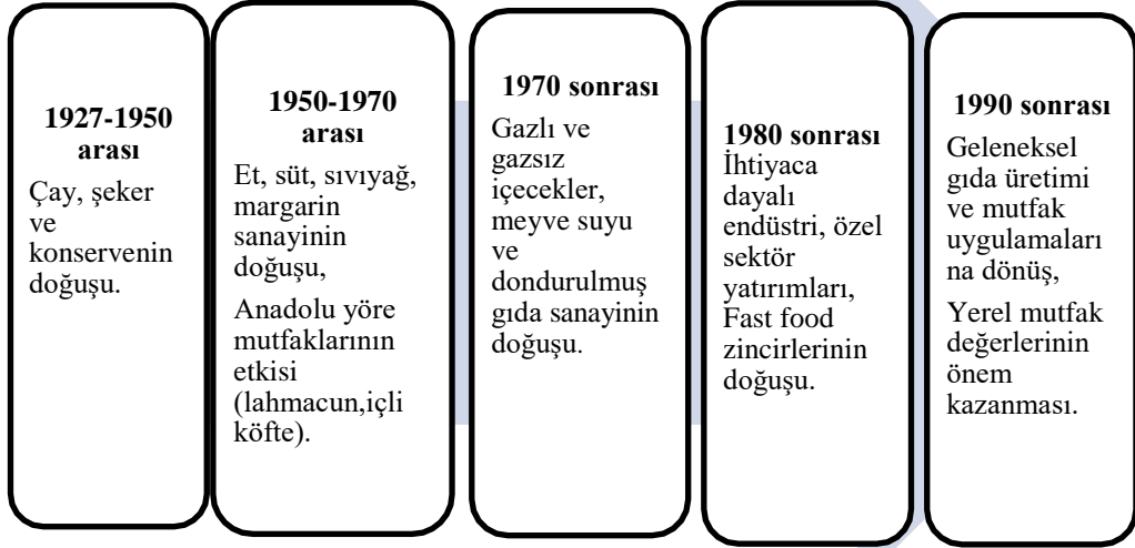
Şekil 2.3: Cumhuriyet ve Sonrası Dönemde Olan Gelişmeler