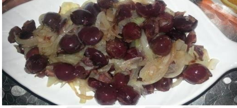
Şekil 2.8: Taflan Kavurması

Taflan Kavurması: Taflan salamurası 5 veya 6 saat önceden suyun içinde bekletilerek, tuzunun çıkarılması sağlanır. Bu işlem sağlandıktan sonra bir tencerede ince doğranmış soğanlar tereyağı ya da sıvı yağ ile kavrulur. Daha sonra tuzu çıkarılmış taflan suyu süzülerek tencereye eklenir. Bir süre daha kavurma işlemine devam edildikten sonra, tercihe göre soğuk ya da sıcak servis edilir (Gürsoy, 2018).