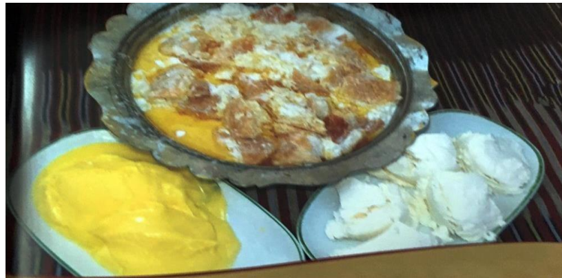
Şekil 2.7: Gelecoş Yemeđi

Gelecoş: Süzme yoğurt kısık ateşte ısıtıldıktan sonra içerisine bayat ekmeđ parçaları ve yoğurt, tuz ilave edilir. Daha sonra üzerine eritilmiş tereyağı ve nane eklenir. Sıcak şekilde servis edilir (T.C. Kültür ve Turizm Bakanlığı, 2020b).