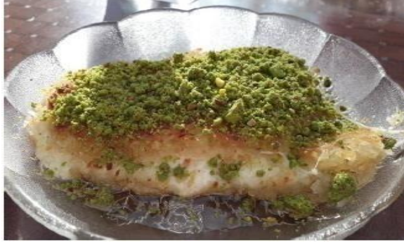
Şekil 2.10: Künefe