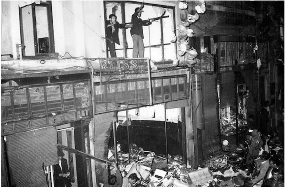
Resim 4.2: Ağır Tahribata Uğrayan Gayrimüslimlere Ait İşyerleri