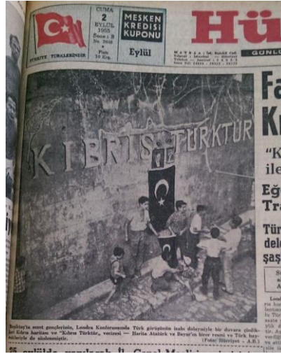
Resim 4.11: Kıbrıs Türk Cemiyetinin Kıbrıs Türklerine Desteği