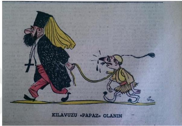
Resim 4.12: Makarios'un Kıbrıs Politikasını Destekleyen Yunanistan'ın Türk Gazetelerinde Karikatürize Edilişi

Aynı gün Zafer Gazetesi'nin manşetinde "Kıbrıs davasını dünyaya bir kendi kaderini tayin hakkı (self determination) meselesi gibi göstermeğe çalışmak yersizdir" ve "Time and Tide dergisi Türkiye'nin bu davada hatasız ve muhkem bir vaziyette olduğunu yazıyor" ifadesine yer verilmiştir. Kıbrıs'ta tedhiş hareketlerinin devam ettiği habere eklenirken, gazetenin ilk sayfasında aşağıdaki karikatüre yer verilmiştir (Zafer Gazetesi, 4 Eylül 1955,s.1).