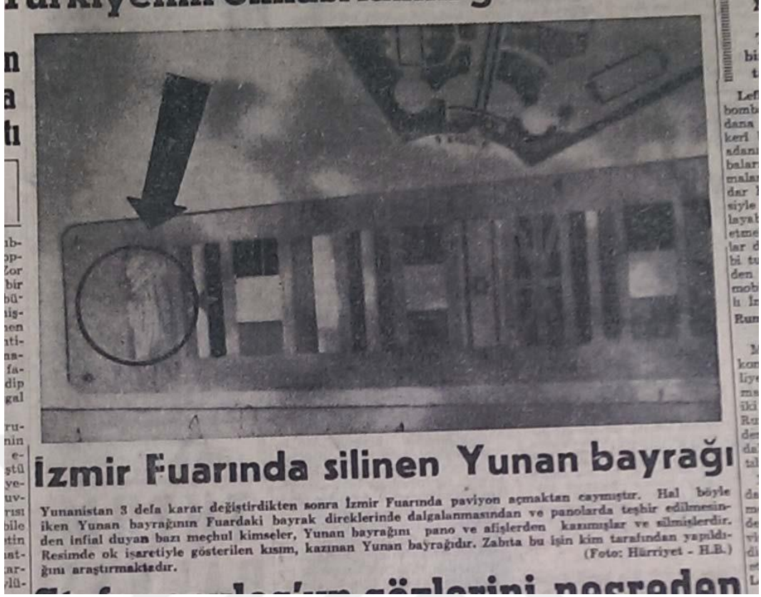
Resim 4.10: İzmir Fuarında Yaşanan Olaylar ve Yakılan Yunan Bayrağı