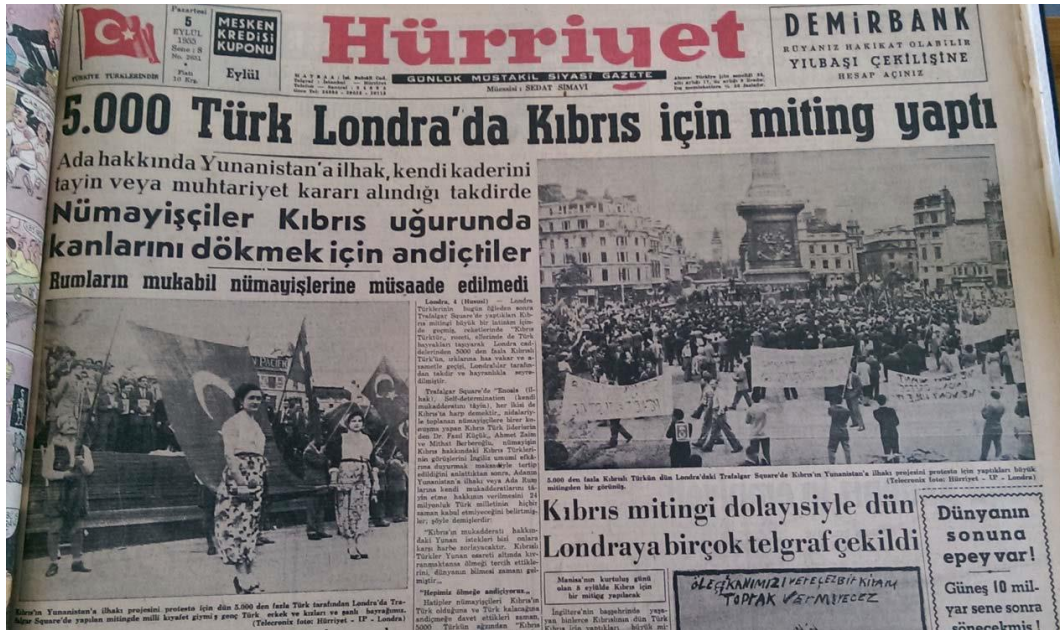
Resim 4.13: Kıbrıs'ta Yaşananlara Dikkat Çekmek İsteyen Türklerin Londra Mitingi.