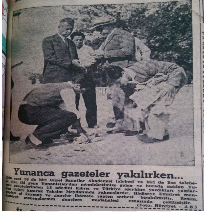
Resim 4.15: Vatandaşların Yunanistanın Kıbrıs Politikalarına Karşı Protestosu