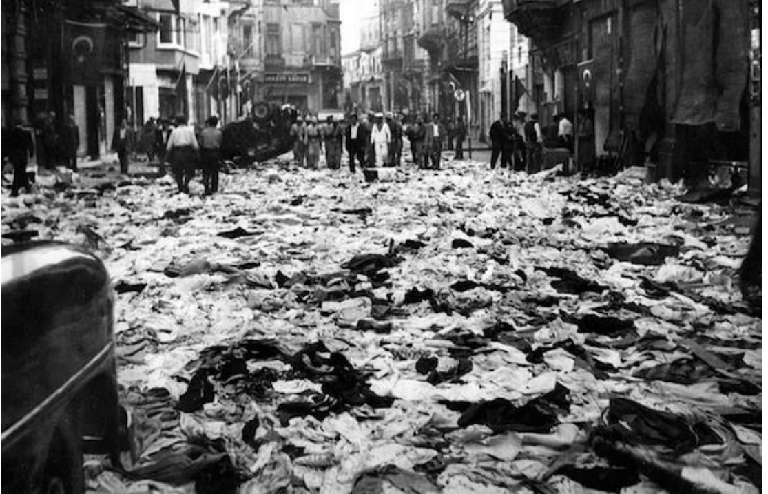
Resim 4.4: Olayların Sabahında Kontrolü Sağlayan Kolluk Kuvvetlerinin Denetimi