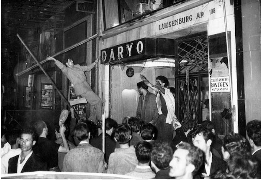
Resim 4.1: Gayrimüslimlere ait Daryo İsimli İşyerine Saldırı Anları