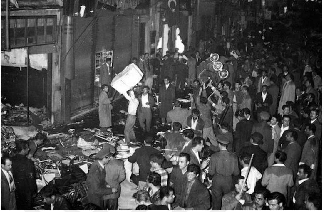
Resim 4.3: Kontrolden Çıkan Olaylara Müdahale Etmeye Çalışan Kolluk Kuvvetleri