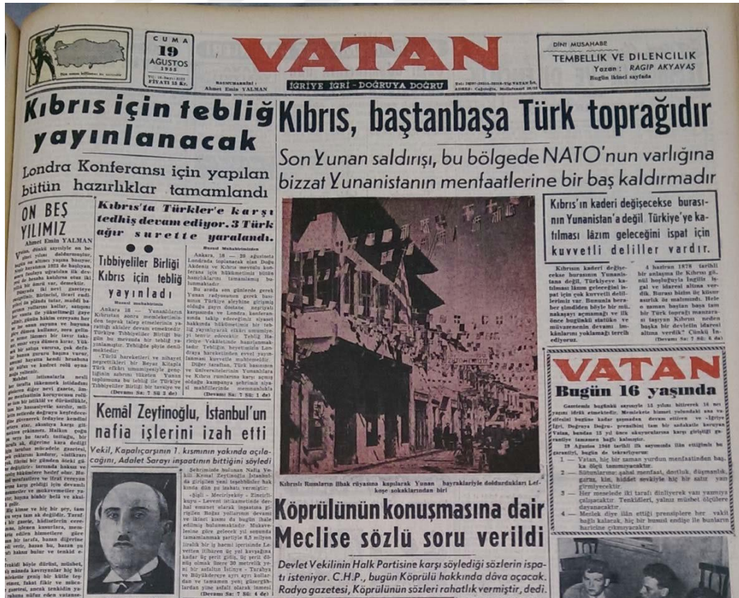
Resim 4.7: Kıbrıs'ta ki Gelişmelere Dikkat Çekmek için Yunanistan Alehtarlığı Manşetten Verilmiş.

19 Ağustos 1955 tarihli Vatan Gazetesi manşetinde, "Kıbrıs, baştanbaşa Türk toprağıdır" ifadesine yer verilmiştir. Haberin giriş cümlesinde "Kıbrıs'ın kaderi değişecekse Yunanistan'a değil,Türkiye'ye katılması lazım geleceğini ispat için kuvvetli deliller vardır" ifadesine yer verilmiştir (Vatan Gazetesi, 19 Ağustos 1955,s.1). Aşağıda eklendiği üzere haberin görselinde Kıbrıslı Rumlar tarafından Yunan bayraklarıyla süslenmiş Lefkoşa sokağı fotoğrafı eklenmiş, Haberin detaylarında Londra Konferansı'nın hazırlıklarının sürdüğü ve aynı zamanda Kıbrıs'ta Türklere karşı terör faaliyetlerinin devam ettiği, Türklere karşı gösterilen bu şiddet sonucunda yaralanmaların da olduğu eklenmiştir (Vatan Gazetesi, 19 Ağustos 1955,s.1).