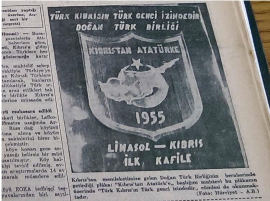
Resim 4.6: Kıbrıs'ta Yaşanan Gelişmelere Karşı Kıbrıs'lı Türk'lere Destek Amaçlı Çıkan Haberler.