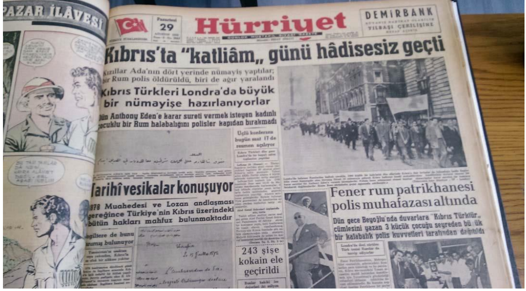
Resim 4.9: Türkiye Ada'daki Gelişmeleri Sür Manşetten Yayınlıyor.