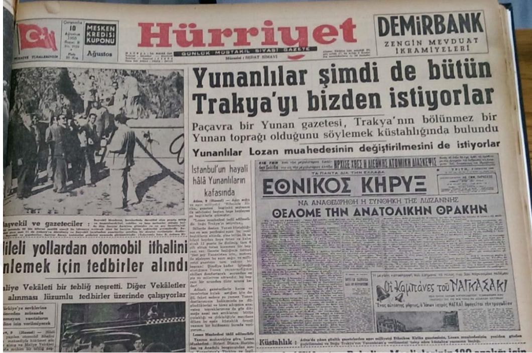
Resim 4.5: Manşetten Verilen Haberde Yunanlılar Hedef Gösteriliyor Kaynak: (Hürriyet Gazetesi, 10 Ağustos 1955)

bölünmez bir Yunan toprağı olduğunu söylemek küstahlığında bulundu” (Hürriyet Gazetesi, 10 Ağustos 1955, s.1).