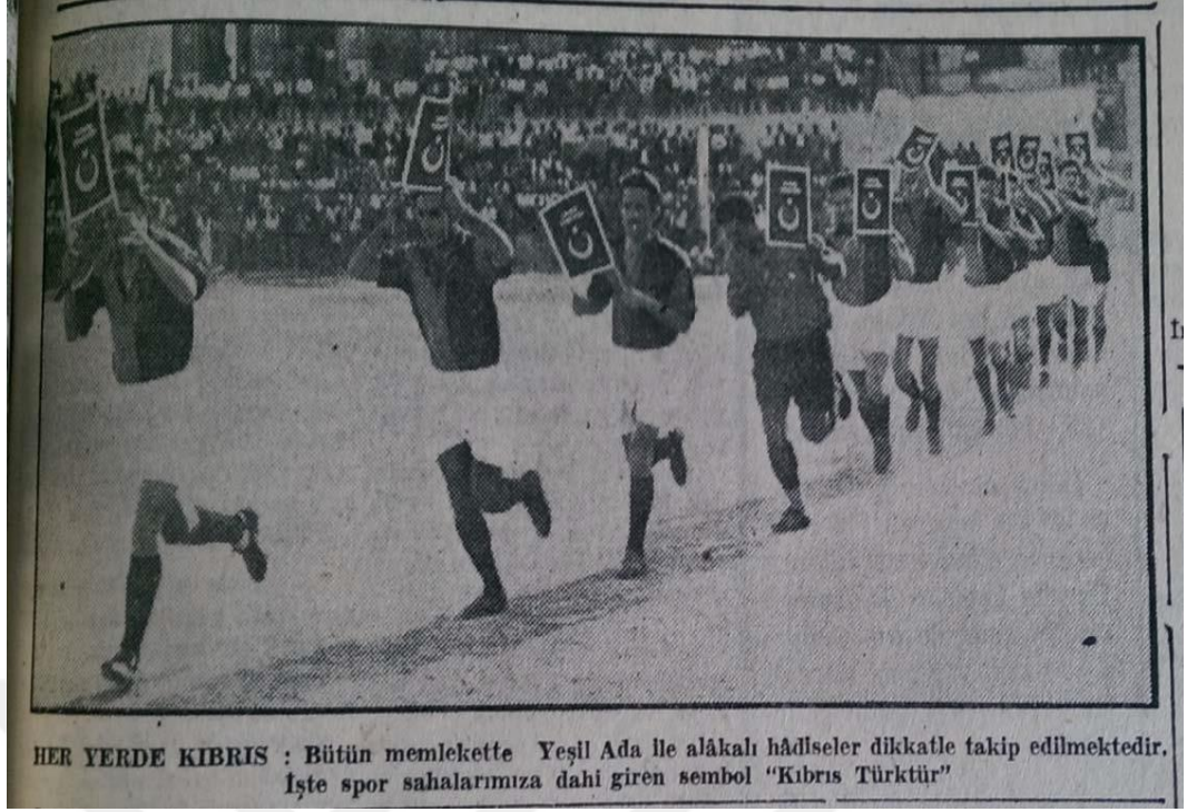
Resim 4.14: Spor Müsabakalarında Takımların Kıbrıs Türklerine Desteği